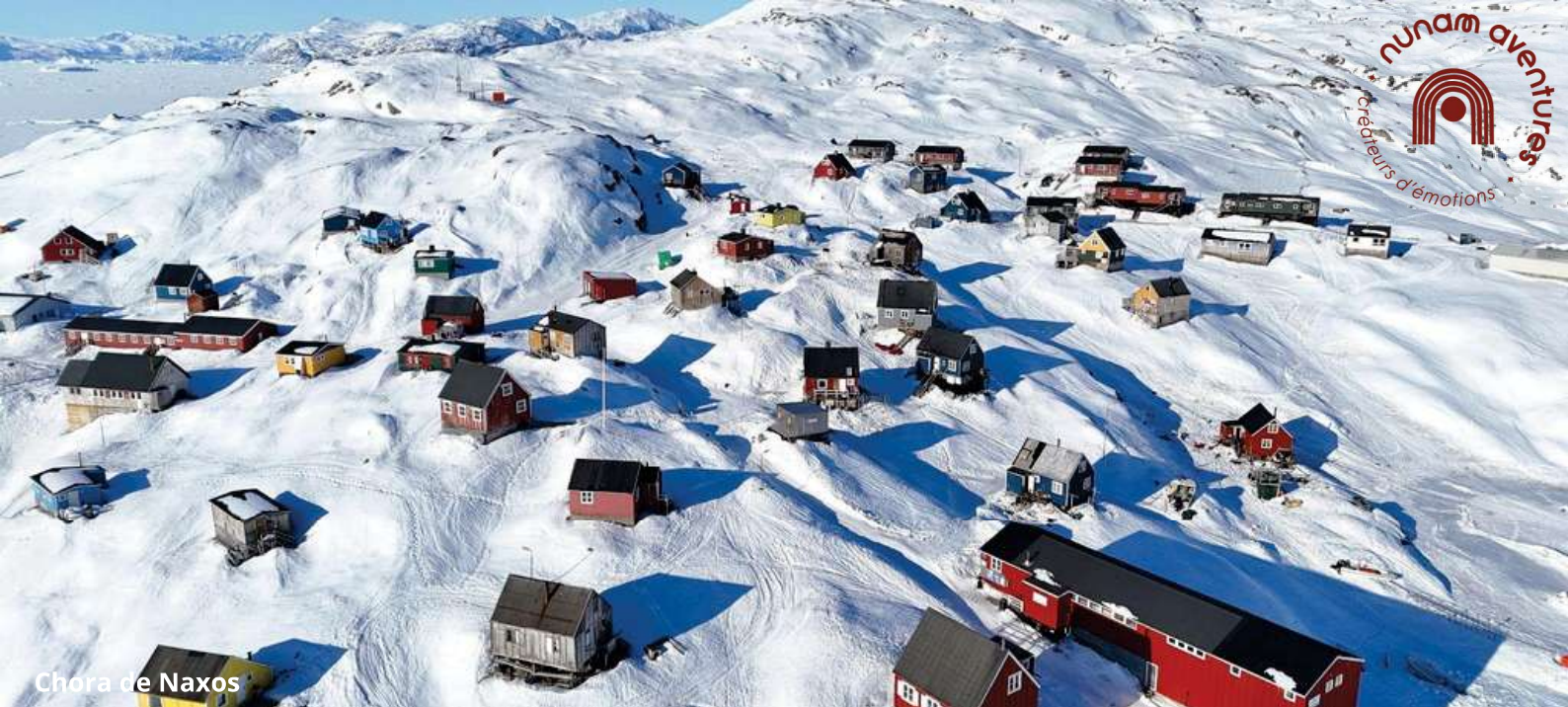
Chora de Naxos