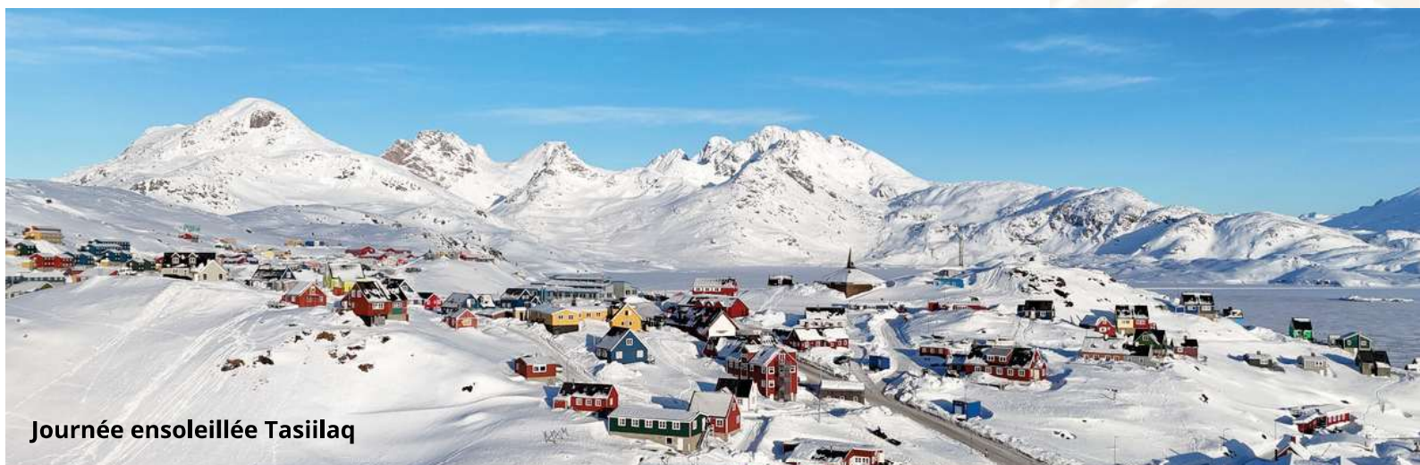
Journée ensoleillée Tasiilaq

Le guide possède une pharmacie pour répondre aux besoins de premiers secours (sans médicament).