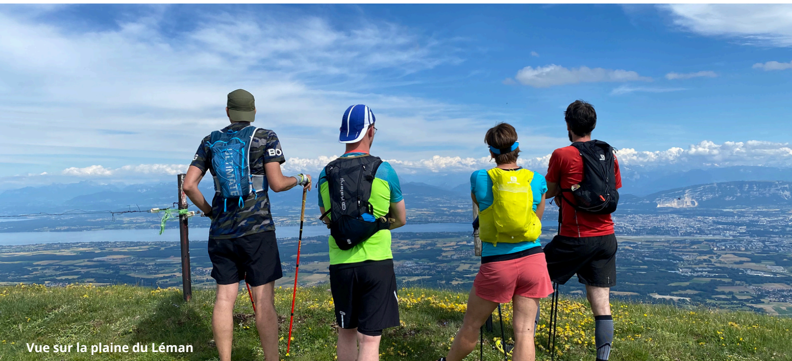
Vue sur la plaine du Léman