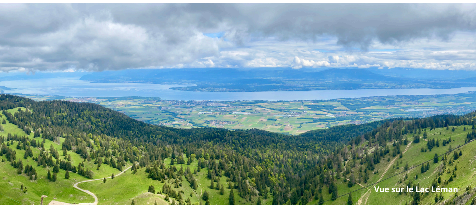
Vue sur le Lac Léman

Le versement d'un pourboire reste à votre libre appréciation. Il n'est pas obligatoire mais très apprécié si vous avez été satisfait du séjour et des petites attentions portées par votre guide.