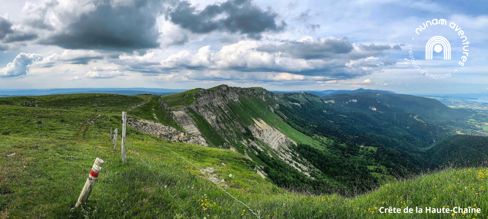
Crête de la Haute-Chaîne