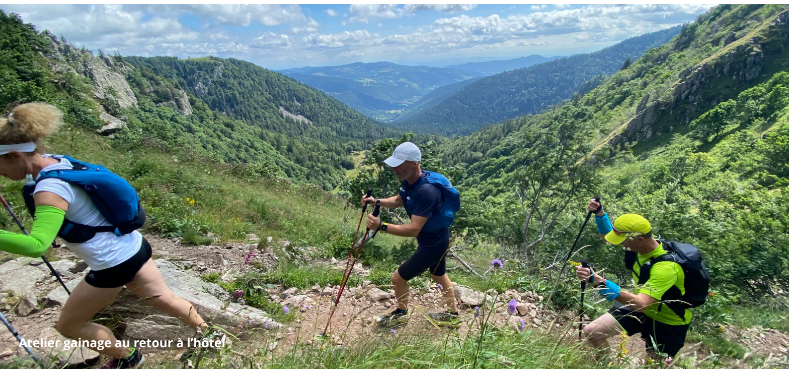
Atelier gainage au retour à l'hôtel

Les temps d'activité et les parcours sont donnés à titre indicatif et peuvent varier (ex : conditions météorologiques, état du terrain, niveau du groupe...). Les temps de transfert peuvent également varier suivant l'état des routes et de la circulation. Si nécessaire (ex : conditions climatiques, aléas aériens, décision des autorités locales), nous pouvons aussi être amenés à adapter le programme dans l'intérêt des participants.