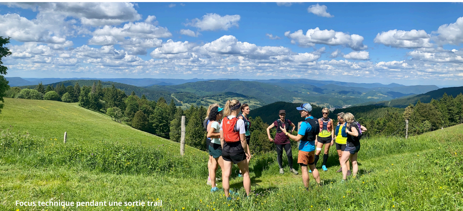
Focus technique pendant une sortie trail