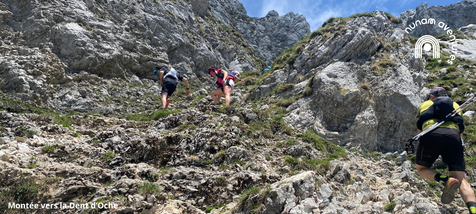
Montée vers la Dent d'Oche