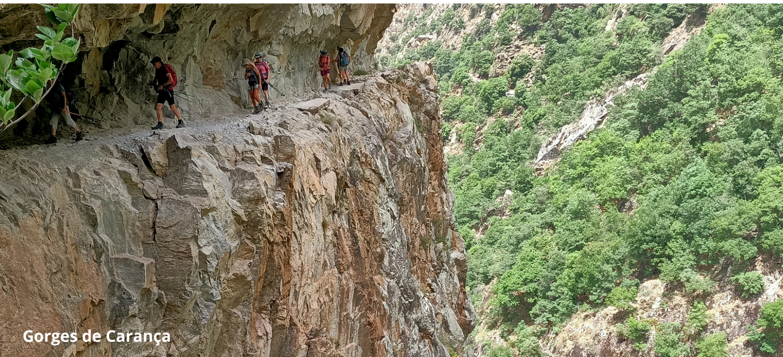
Gorges de Carança