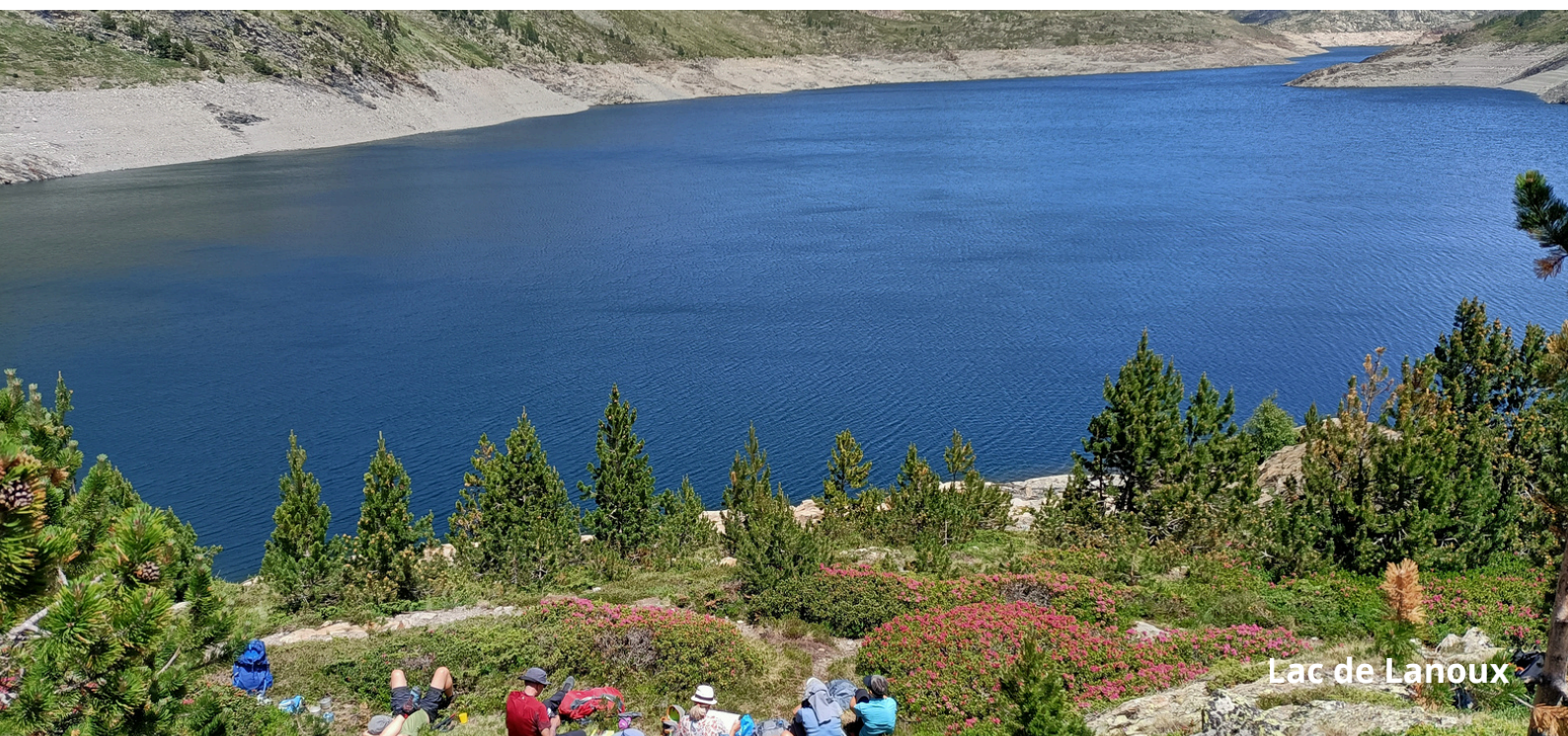
Lac de Lanoux