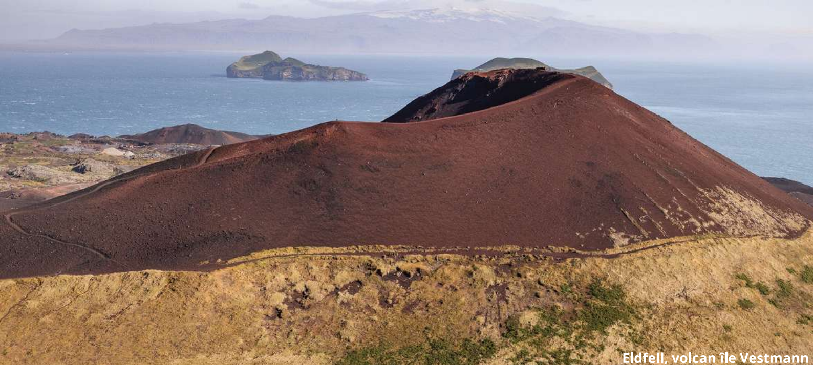
Eldfell, volcan île Vestmann