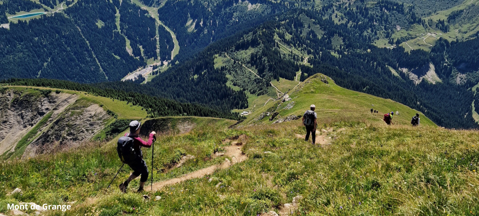
Mont de Grange