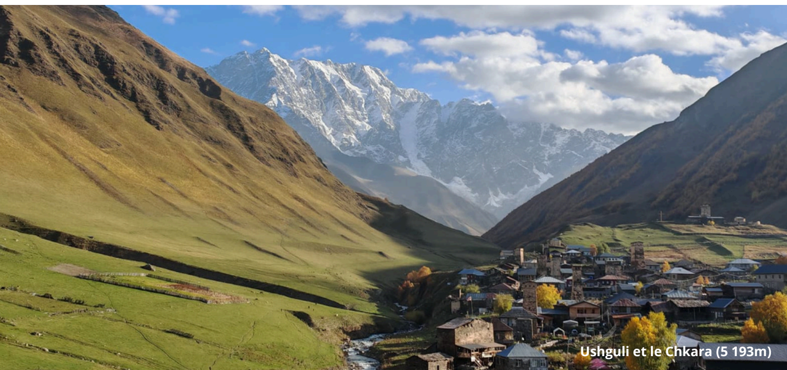
Ushguli et le Chkara (5 193m)

Ce séjour en Géorgie est une invitation à la contemplation, à l'émerveillement. C'est une rencontre avec un pays où chaque regard ouvre un horizon nouveau, où la simplicité du quotidien se mêle à la grandeur des paysages. Marcher ici, c'est redécouvrir l'une des beautés du monde dans sa forme la plus pure.