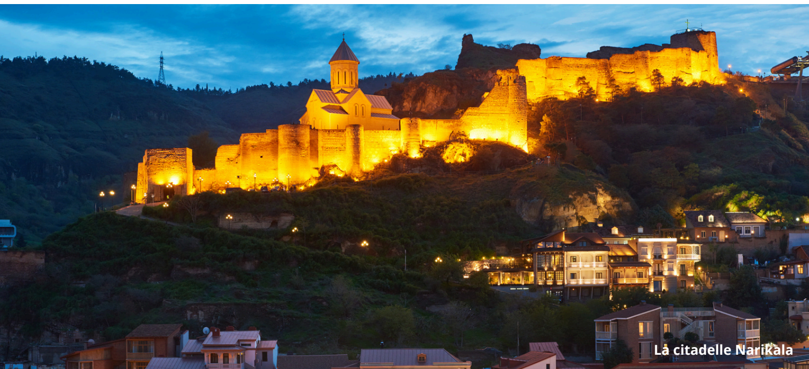
La citadelle Narikala

Pas besoin d'adaptateur pour les prises de courant.