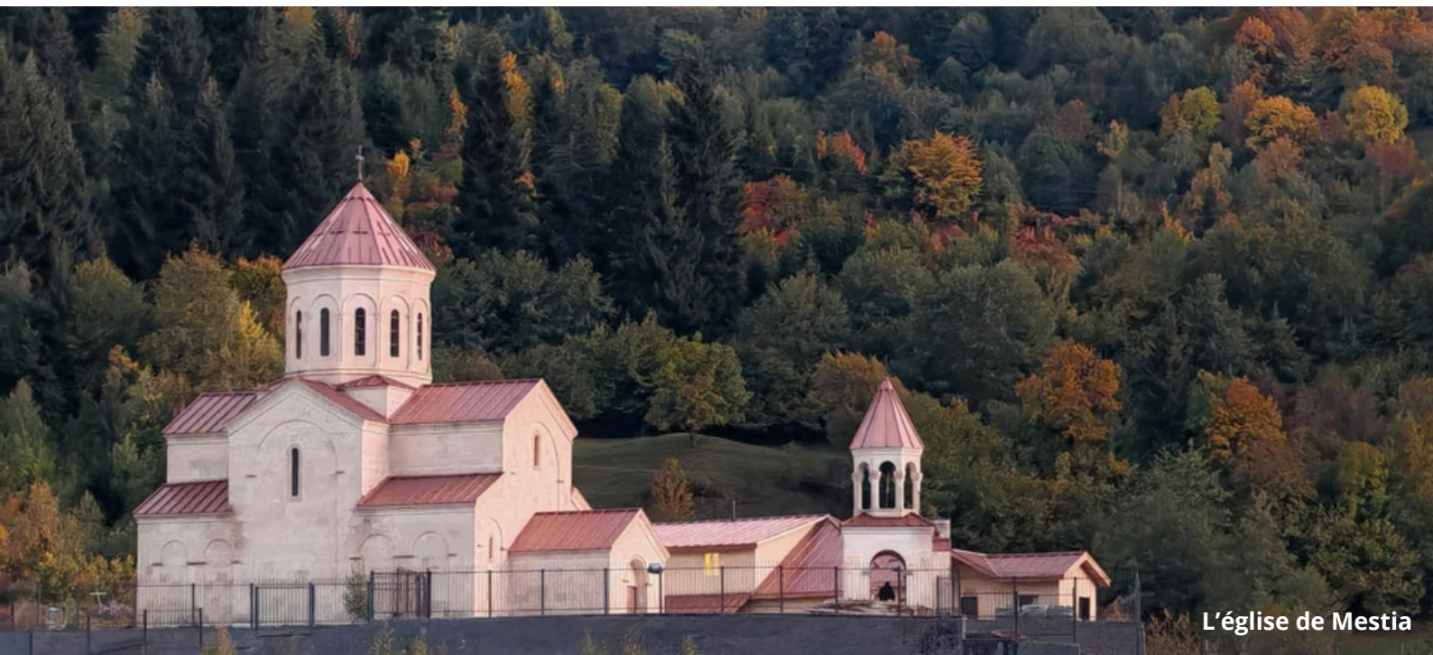
L'église de Mestia

Le versement d'un pourboire reste à votre libre appréciation.