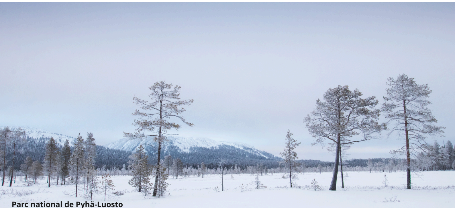
Parc national de Pyhä-Luosto