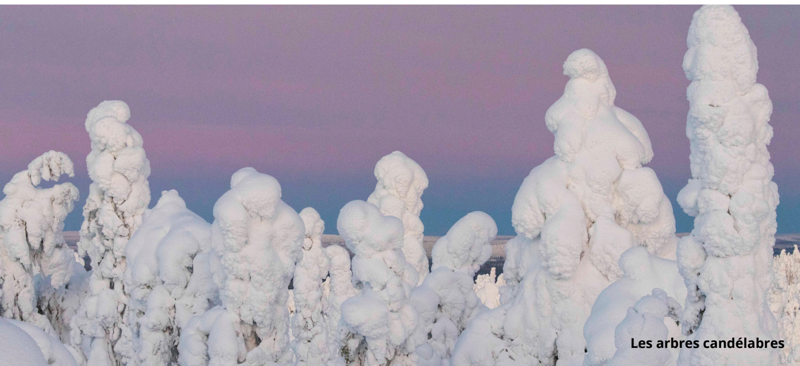
Les arbres candélabres