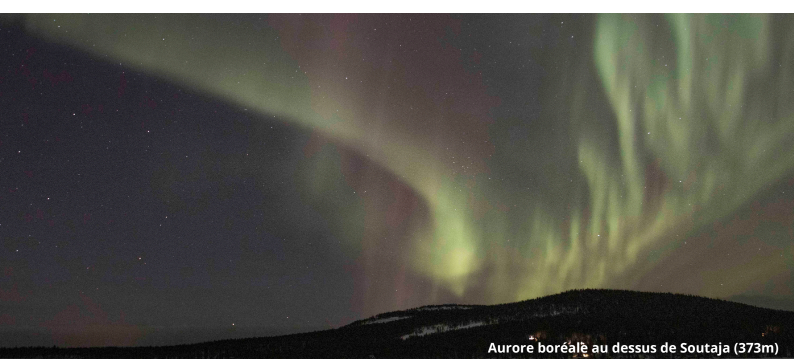
Aurore boréale au dessus de Soutaja (373m)