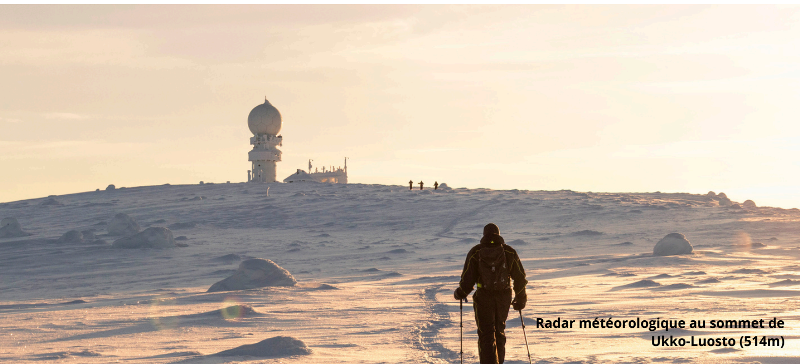
Radar météorologique au sommet de Ukko-Luosto (514m)

Pas besoin d'adaptateur pour les prises de courant.