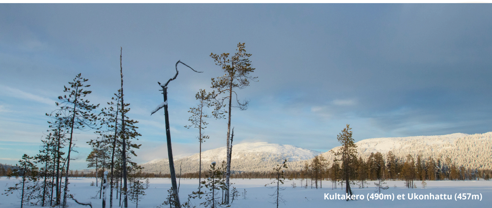
Kultakero (490m) et Ukonhattu (457m)

Ce séjour en Laponie finlandaise est une invitation à ralentir, à écouter le silence et à se laisser porter par la magie de l'hiver arctique. Dans ces paysages immaculés, la nature se révèle dans sa forme la plus essentielle : vaste, lumineuse et infiniment apaisante. Marcher dans les forêts de Pyhä-Luosto, c'est entrer dans un univers où le temps semble suspendu, et où chaque instant devient une rencontre avec la beauté brute du Nord.